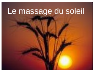
Le massage du soleil